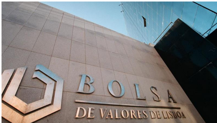
Fachada da bolsa de valores de Lisboa

As cotadas do PSI 20 têm conseguido aumentar os lucros nos últimos trimestres. Energéticas e papeleiras são das que mais poderão surpreender.