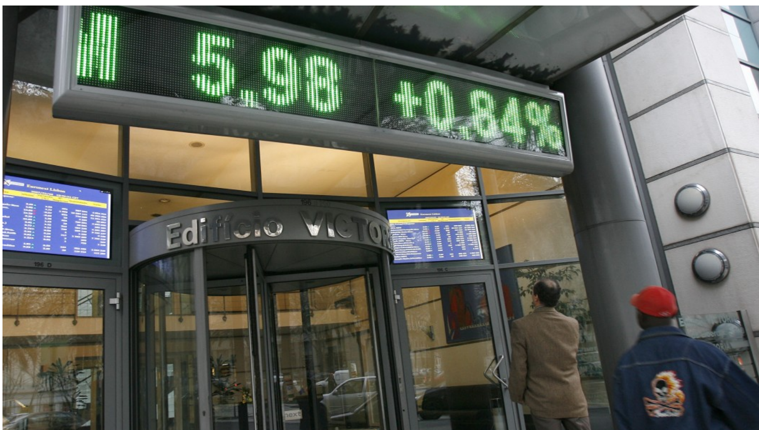
Euronext Lisboa.